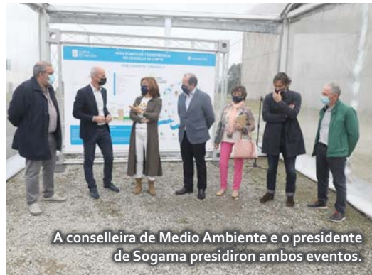
A conselleira de Medio Ambiente e o presidente de Sogama presidiron ambos eventos.

As novas plantas de transferencia de Ponteceso e de Curtis son parte das 17 infraestruturas previstas polo Goberno autonómico -algunhas delas de nova creación e outras xa existentes- que contan cun investimento comprometido de 35 M€ para apoiar ás entidades locais no cumprimento dos obxectivos da UE en xestión de residuos.