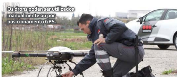
Os drones poden ser utilizados manualmente ou por posicionamento GPS.

Traballadores da área de seguridade, debidamente formados, autorizados e habilitados como pilotos de drones, son os encargados de manexar este tipo de dispositivos aéreos que permiten combinar distintas técnicas de supervisión con cámaras térmicas e de alta definición. En concreto, a cámara térmica infravermella/RGB mide a temperatura da imaxe, e a de alta definición, cunha sensibilidade vinte veces superior á do ollo humano, toma imaxes de moi alta calidade. Son tarefas de videovixilancia e control perimetral moi minuciosas, xa que