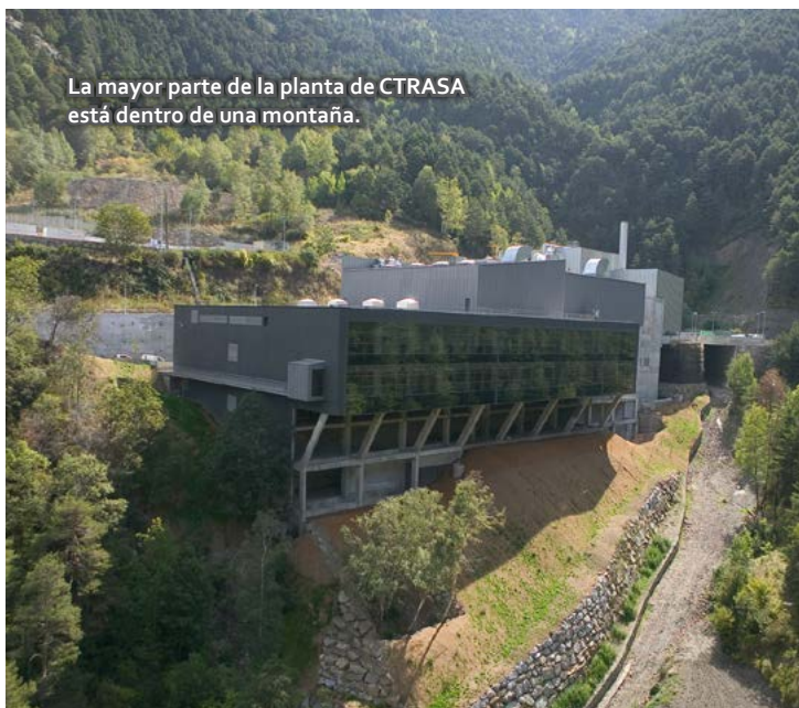
La mayor parte de la planta de CTRASA está dentro de una montaña.

Para nosotros es una gran oportunidad poder formar parte de AEVERSU porque nos permite participar en sus grupos de trabajo temáticos donde los miembros pueden poner en común, aspectos que nos preocupan o temas a debatir, en el ámbito de la seguridad, el medioambiente, la operación, el mantenimiento y la comunicación. Creo que este es el gran valor que aporta la asociación y es así porque se participa desde el punto de vista de profesionales que colaboran de forma desinteresada para ayudarse mutuamente. El sector de la valorización energética cuenta con pocas instalaciones y poder poner en común las cuestiones que nos afectan