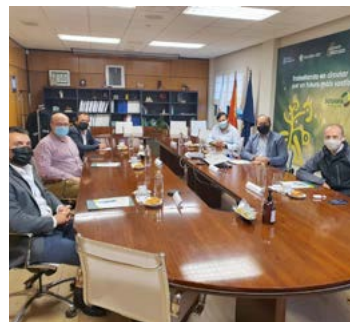
Visita de Recyclia e Fundación Ecomar, así como da Deputación de Huelva (arriba), e do goberno rexional de Murcia e Consorcio para o Tratamiento de Residuos Urbanos do Maresme -Mataró- (abaixo).