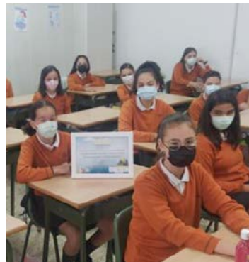
Alumnado dos centros gañadores de Vigo, Xove e Ourense posando cos seus diplomas.

Alumnos do CEIP Plurilingüe Pintor Laxeiro de Vigo e do CEIP Plurilingüe Pedro Caselles Rollán de Xove (Lugo) acadaron os primeiros premios do concurso do "Recíclate con Sogama" 2020-2021. Xunto co diploma de recoñecemento, cada centro recibiu un galardón dotado cunha achega de 1.000 euros para a adquisición de material didáctico ou o desenvolvemento de accións educativas.